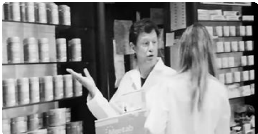
Fotogramma da Il Morso del Ramarro (2021)

Utilizziamo l'ironia nel posizionamento dei prodotti affinché