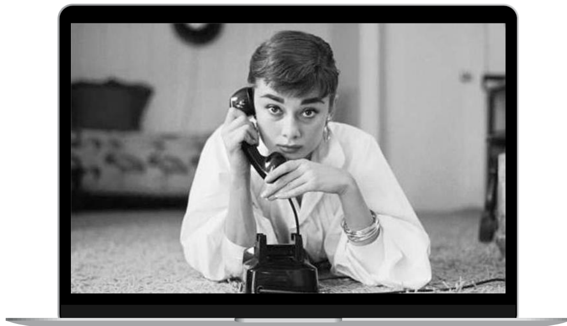
Audrey Hepburn on the Phone, December 7, 1953