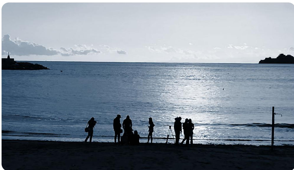
Backstage delle riprese de Il Morso del Ramarro (2021)

Siamo profondamente legati al Golfo del Tigullio e amiamo condurre le nostre attività a beneficio del territorio, ma siamo anche presenti in altre realtà nazionali che ci appartengono, dal Friuli alle Langhe e alla Sardegna