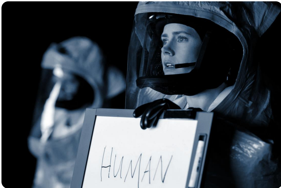
Fotogramma da Arrival (2016)