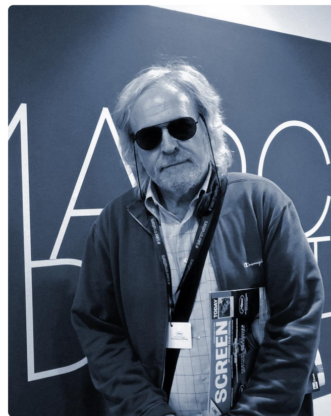
Nerio Bergesio al Festival di Cannes (2021)

Grazie a canali come Ipotesi Cinema, le Film Commission, il circuito LAND e le diverse collaborazioni, siamo sempre aggiornati sulle opportunità e le novità di settore