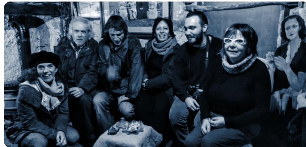
Sul set di CIMA Prod Srl ©